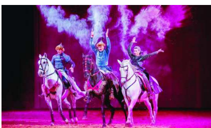
Le festival Equestria est devenu, au fil des années, la référence en matière de spectacles équestres... ©

FESTIVAL Du mardi 28 juillet au dimanche 2 août, de 10 h 30 à 11 heures du matin, le festival Equestria se lance à l'assaut de Tarbes.